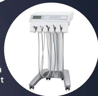
Подкатной модуль Cart