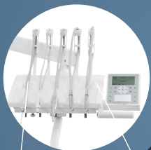
Блок с верхней подачей инструментов