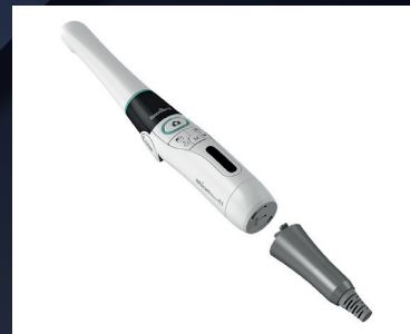
ИНТРАОРАЛЬНАЯ КАМЕРА WHICAM III

Отражатель, защита от перегрева, вентилятор и съемные автоклавируемые ручки - все это делает галогеновый светильник Faro EDI (Италия) особенно удобным в работе.